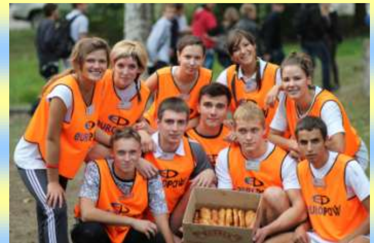
Команда з баскетболу