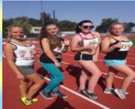
Легка та важка атлетика