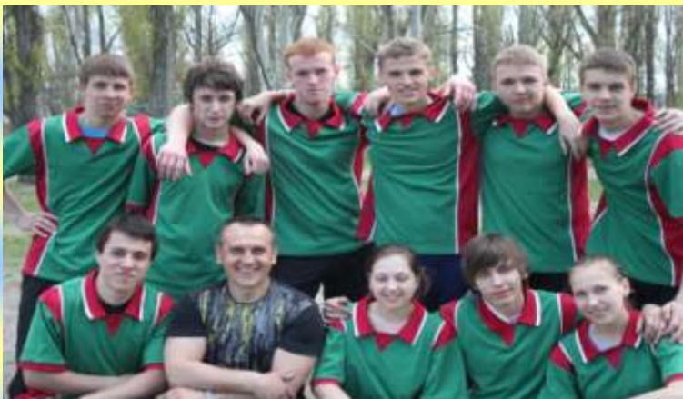
Команда з футболу