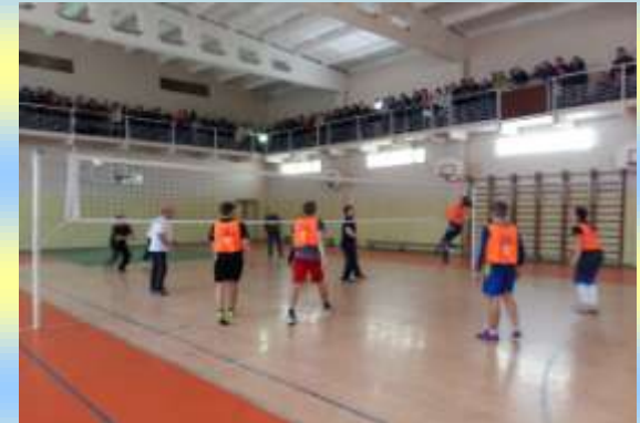
Змагання викладачі - студенти