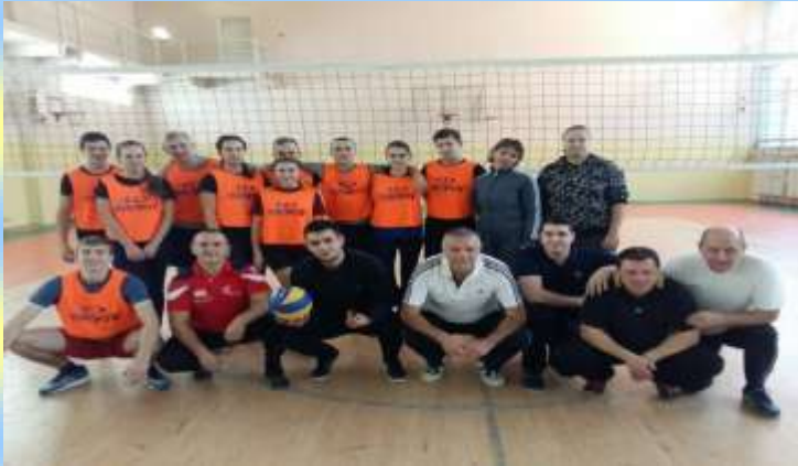
Команда з волейболу